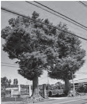
▲瀧泉寺の大銀杏 (いすみ市大原。広常が植えた と伝わる。)