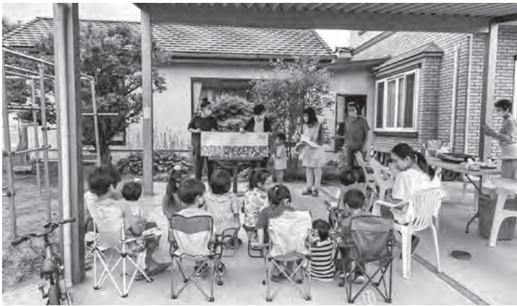
▲子どもたちへのお話会