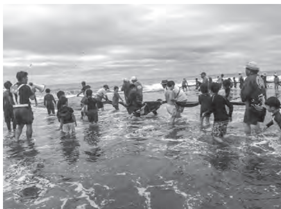
▲地曳網 7.17朝 新浜海岸