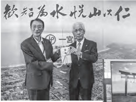
▲ (左) 馬淵町長 (右) 山ノ井社長