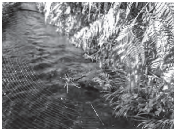
▲ジョロウグモの亜成体 8.3朝 松子川にて